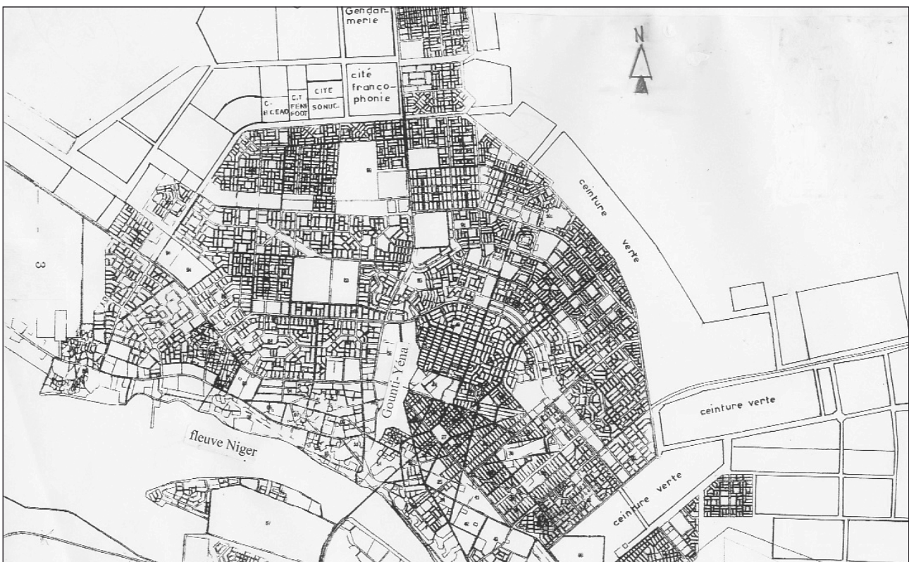
MAP 1.0: PLAN DE LA VILLE DE NIAMEY

L'approvisionnement en eau potable dans les centres urbains est assuré par la Société d'exploitation des eaux du Niger (SEEN), au moyen de réseaux de distribution desservant cinquante et un centres. Le taux de couverture des besoins en eau potable en milieu urbain est de 85 %, contre 57% en zone rurale. Les coupures d'eau, parfois prolongées, sont courantes dans divers centres desservis par la SEEN. La situation devient particulièrement pénible dans certains quartiers tant centraux que périphériques de la ville de Niamey. La vétusté avancée des conduites en fonte qui composent le réseau d'adduction explique ces dysfonctionnements fréquents. Des actions de réhabilitation ont pourtant été entamées dans le cadre du projet sectoriel de l'eau.