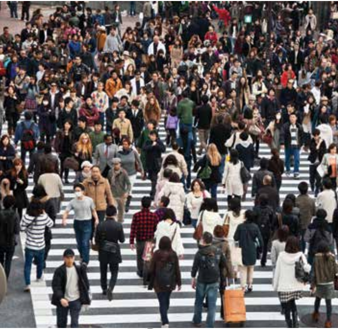
Pedestrians in Tokyo - Japan