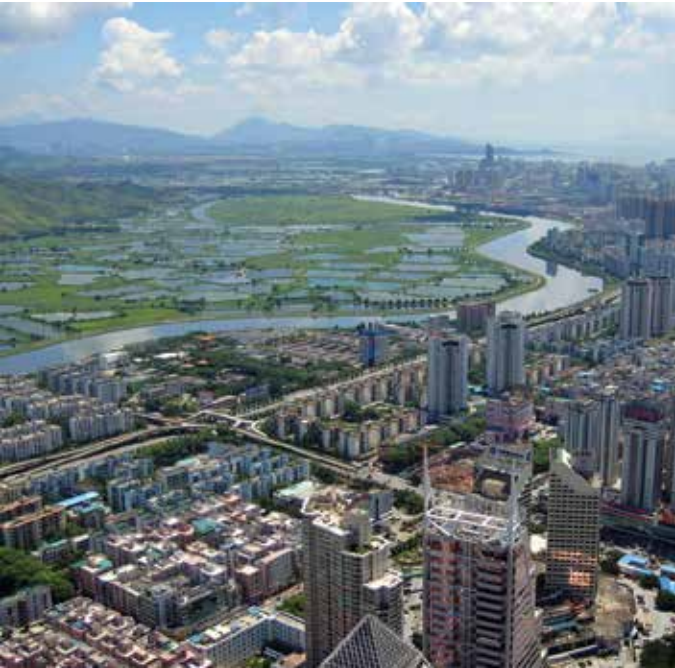
Aerial View of Shenzhen-China