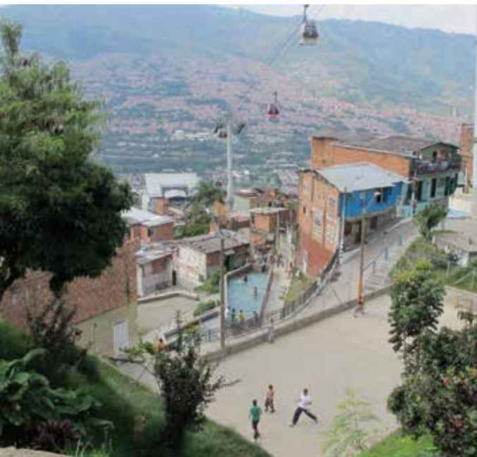
Public Space in Medellin- Colombia