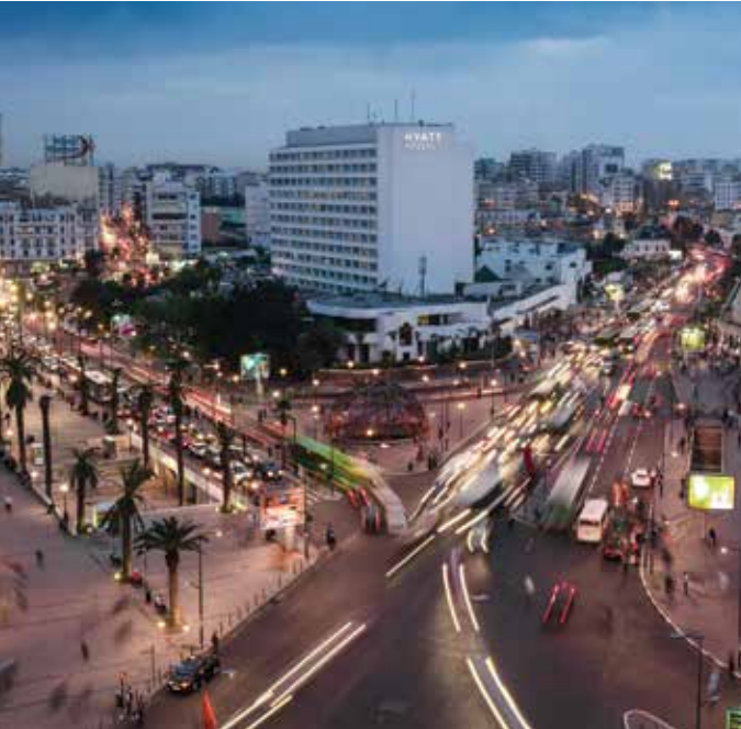
Place of United Nations in Casablanca-Morocco