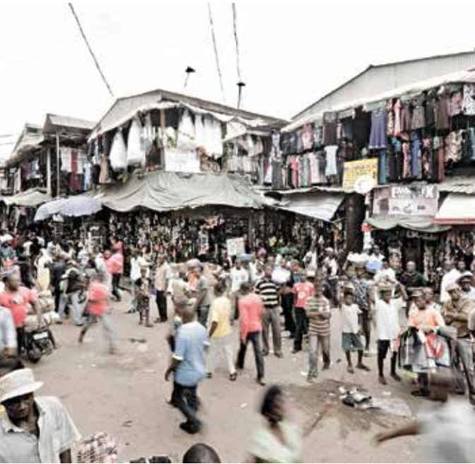
Market Place at Onitsha -Nigeria