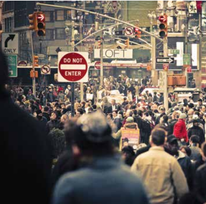
Street in New York- USA