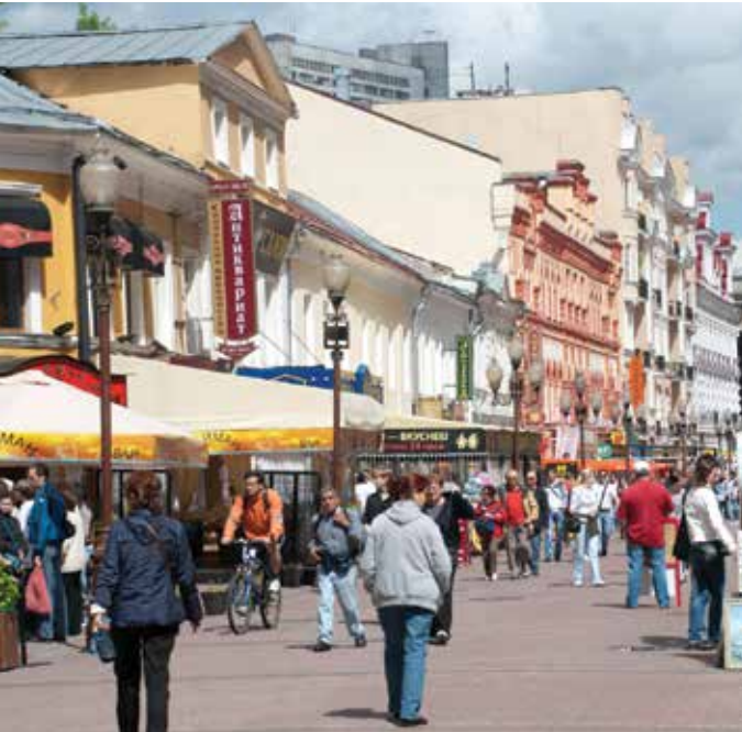
Pedestrian Street in Moscoe-Russia