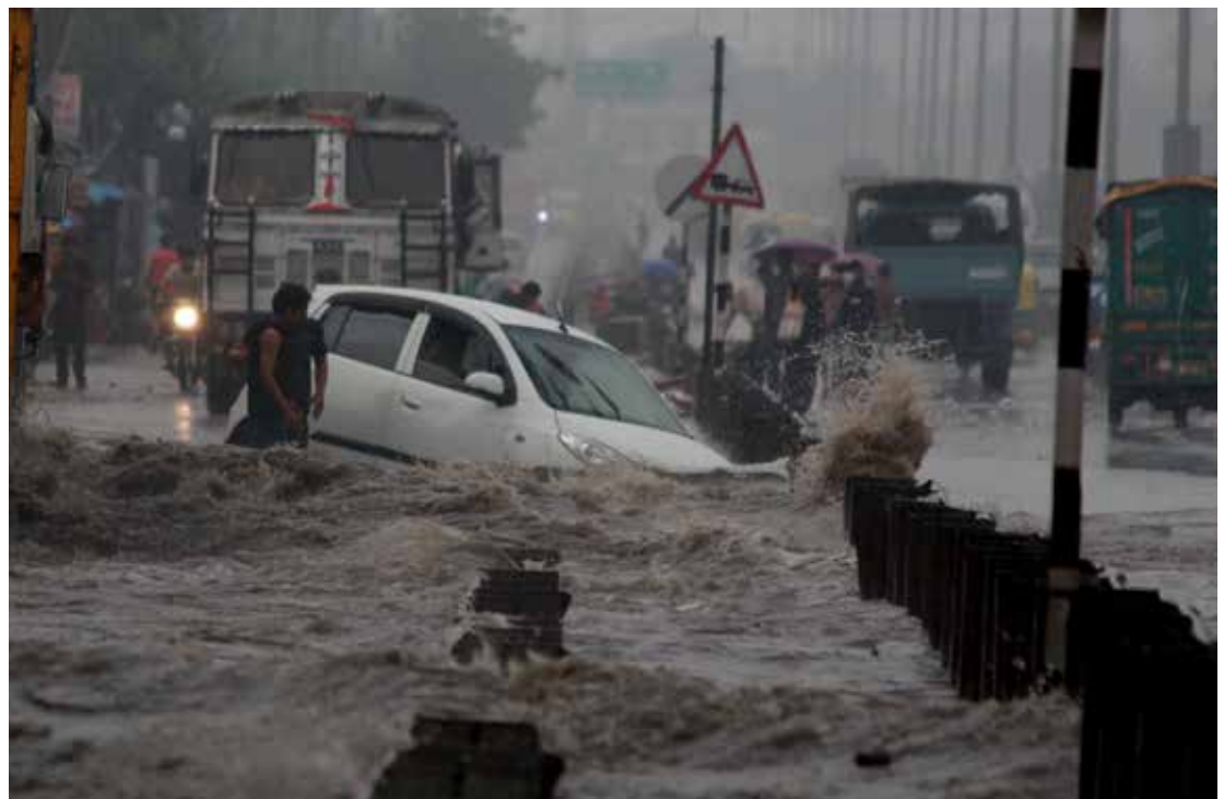
Последствия изменения климата. Затопление дороги в Городе тысячелетия Гургаоне. Харьяна, Индия

Необходимо предпринять эффективные меры для того, чтобы сфокусироваться на наиболее важных стратегических действиях, направленных на преодоление структурных и системных препятствий, что будет способствовать достижению значимого результата и повышению эффективности инвестиций.