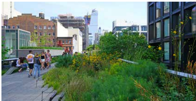
Вид на Хай-Лайн, надземный зелёный городской парк в Нью-Йорке