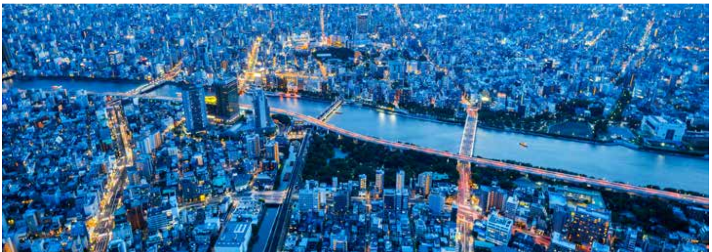
Панорамный вид на городской пейзаж Токио под сумеречным небом и ночным неоновым освещением, Япония