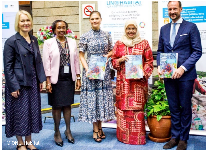
Figura 3: Victoria, Princesa Heredera de Suecia; Maimunah Mohd Sharif, Secretaria General Adjunta y Directora Ejecutiva de ONU-Hábitat; Haakon, Príncipe Heredero de Noruega en el acto de presentación del informe, noviembre de 2022.

Aunque no existe una solución única para todos los casos, ya que las circunstancias y las personas implicadas en el proceso difieren, el informe concluye afirmando que es necesario supervisar una transición justa del SIVR utilizando indicadores, definiciones y técnicas establecidas y determinadas conjuntamente. En la actualidad, la escala y las operaciones del SIVR en todo el mundo son poco conocidas y carecen de datos. Para colmar las lagunas de conocimiento sobre el papel de los SIA, es necesario determinar el alcance de las redes actuales y las relaciones comerciales, los factores socioeconómicos y las interconexiones con el sector formal.