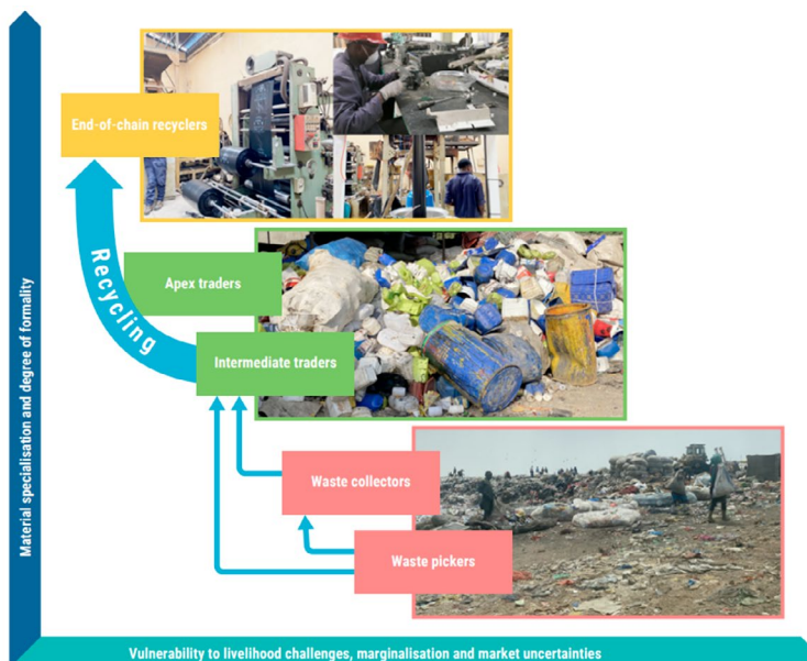
Figura 1: Diagrama conceptual de los actores del IWRS en la cadena informal de recuperación del plástico, incluyendo su grado de vulnerabilidad, así como la especialización material y la formalidad, ONU-Hábitat, 2022

Especialmente en los países emergentes, la rápida expansión de la población ha provocado un aumento extraordinario de la producción de residuos. Por ejemplo, solo los residuos anuales de aparatos eléctricos y electrónicos (RAEE) en todo el mundo han pasado de 33,8 a 49,8 millones de toneladas entre 2010 y 2018 3 . Incluso con la incineración y otros métodos de tratamiento de residuos, los vertederos siguen siendo el método más popular de eliminación de residuos en los países en desarrollo. Estos países suelen carecer de la financiación necesaria para una gestión adecuada de los residuos, y la adopción de tecnologías de tratamiento de residuos más avanzadas es escasa. Sin una gestión adecuada, muchos vertederos plantean grandes riesgos, como demostró el deslizamiento de tierras de Shenzhen (China) en 2015.